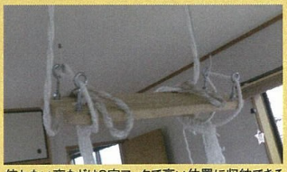
使わない夜などはS字フックで高い位置に収納できる。